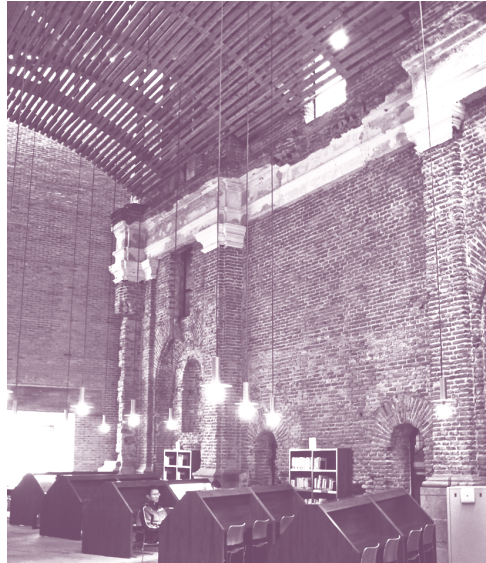
Figura 4: Escuelas Pías de Lavapiés de Madrid, proyecto de intervención del arquitecto Ignacio Linazasoro. La labor de investigación relacionada con el Patrimonio Edificado se nutre del análisis de casos que permitan reflexionar sobre los fundamentos para valorar, conservar e intervenir espacios preexistentes, a través de proyectos de reutilización.

La investigación en y sobre el diseño tiene un alto vínculo con el patrimonio cultural, en todas sus ramas y con todas sus posibilidades. La aproximación que, desde el área interdepartamental, se desarrolla con res-