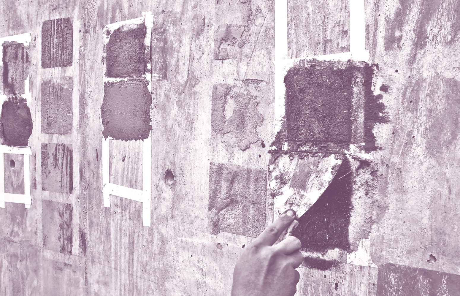
Figura 1. Práctica del Seminario-Taller de Tecnologías Alternativas de Construcción y Reutilización Arquitectónica realizado en CyAD Xochimilco. Algunas actividades vinculadas con la investigación pasan por procesos de experimentación, para evaluar alternativas que permitan seleccionar aquellas que podrán ser aplicadas a casos concretos.