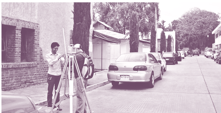
Figura 3: Práctica del Seminario-Taller de Tecnologías Alternativas de Construcción y Reutilización Arquitectónica realizado en CyAD Xochimilco. Algunas actividades vinculadas con la investigación pasan por procesos de experimentación, para evaluar alternativas que permitan seleccionar aquellas que podrán ser aplicadas a casos concretos.