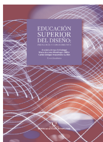
Portadas de los libros que conforman la Trilogía Arte, Diseño y Educación .