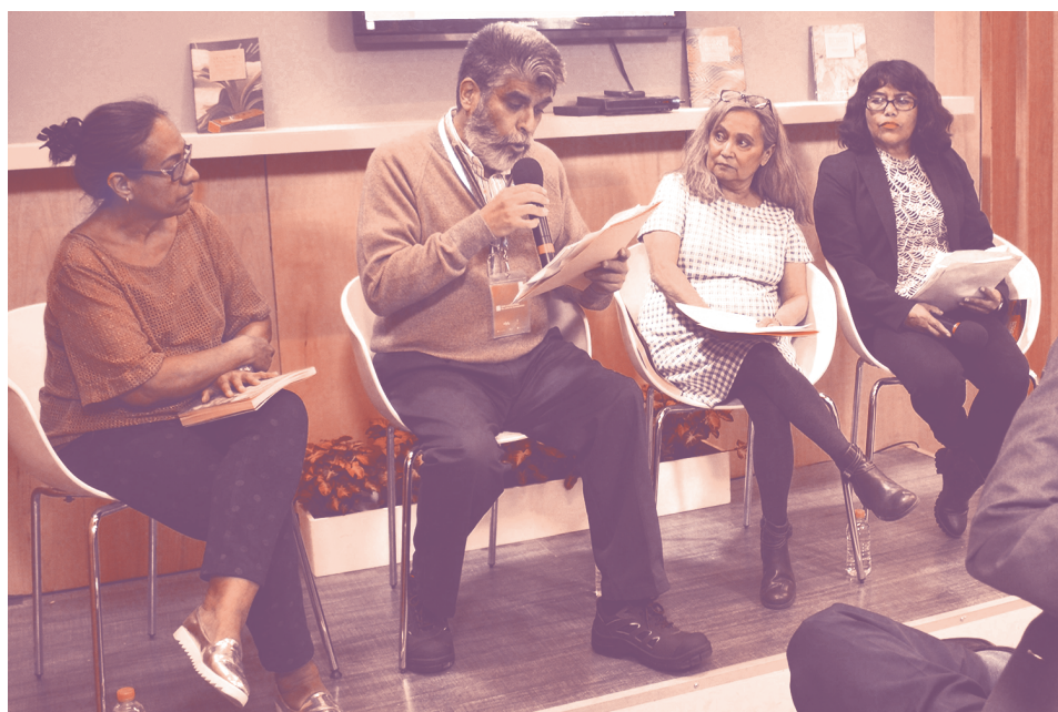
Presentación de la trilogía Arte, Diseño y Educación .

Finalmente y para concluir con esta presentación, en palabras de Carlos Arozamena Guillén, esta triada intenta abordar cómo es que las actividades del diseñador resultan más complejas de lo que pudiera pensarse; el diseño entonces requiere del trabajo conjunto de dis-