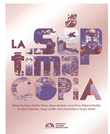
Portada del libro La séptima copia .