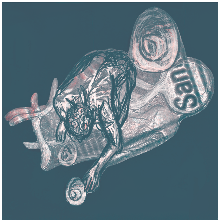
Cartografía 8 Ilustración: Martha Flores

partir de ideas y bocetos previos que quedaron esbozados en el documento escrito, mismo que sirvió de punto de partida para diversas reflexiones y textos, como los de apoyo para la tesis doctoral que estaba realizando y que posteriormente tomó otro rumbo. Las ideas iniciales siempre me llamaron la atención para desarrollarlas en otro momento: la idea de cartografías del cuerpo, la relación cartográfica entre cuerpo y rumbo, rumbo y creación de ciudad, la creación de trayectos desde y para el cuerpo... ideas que de alguna manera están marcadas en la obra gráfica presentada.