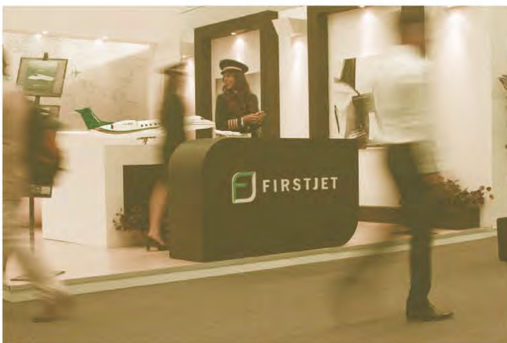
Figura 4. Proyecto FIRSTJET