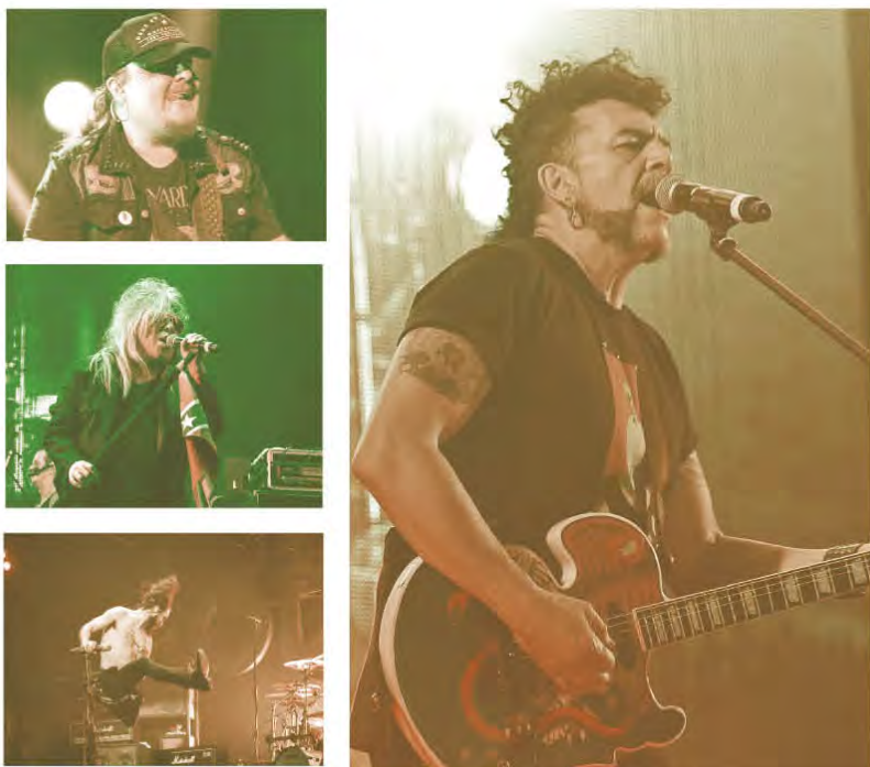
Figura 2. Conciertos de Moderatto, Charlie Montana y Botellita de Jeréz

También intenté vivir como freelance y tuve la fortuna de trabajar en proyectos muy divertidos de diseño web y foto para algunas bandas de música; en ese punto me di cuenta que no basta con saber de temas de diseño, es importante conocer sobre negocios, ventas, comunicación incluso finanzas personales; estuve un año trabajando así y terminé endeudado y más confundido, pero tenía un book con más credibilidad por los clientes con