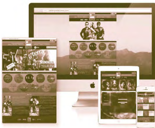
Figura 3. Website Bunkers

LF: Además de las habilidades técnicas de diseño, creo que es indispensable