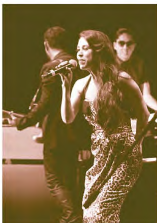
Figura 5. Belanova