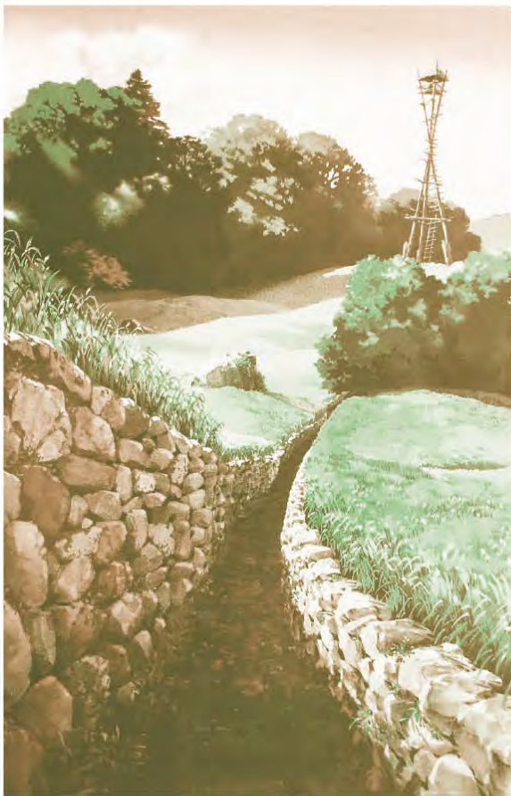
Figura 3: Fragmento de la película “La Princesa Mononoke” de Hayao Miyazaki Tomada de: Hayao Miyazaki, “The Art of Princess Mononoke”, pp. 21, Viz Communications, 2014.

Como ejemplo de esto tenemos al cineasta japonés Hayao Miyasaki, leyenda viva del cine de animación, quien ha venido manejando el tema sobre el cuidado de la naturaleza y el respeto al ecosistema. En cintas como Nausicaä of the Valley of the Wind , Ponyo y La princesa Mononoke , entre otras, queda de manifiesto su posición ambientalista. En sus películas, el entorno natural se convierte en un protagonista que juega un papel importante en el desarrollo de la trama, que en muchas ocasiones influye directamente en los personajes.