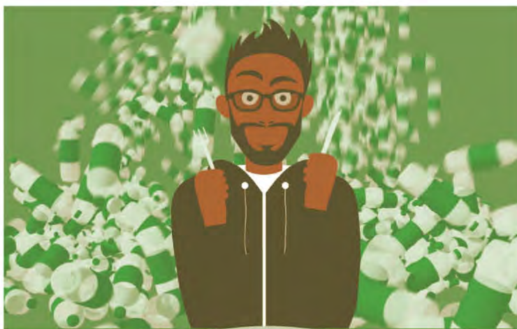
Figura 7: Captura del cortometraje PETer PLASTIC de Saiki Studio Tomada de: https://vimeo.com/165981683

Como conclusión, podemos afirmar que la crisis mundial que el calentamiento global, la escasez de recursos naturales y la notoria degradación del medio ambiente han generado, ha impulsado movimientos a nivel mundial para llevar a cabo múltiples campañas de concientiza-