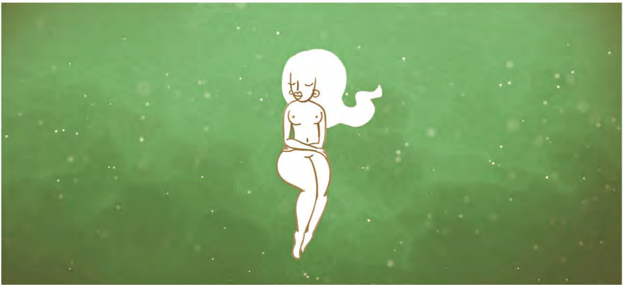
Figura 5: Captura del cortometraje A Secas realizado por: Lllamarada de Petate

por ejemplo, el cortometraje A secas , producido por el estudio "Lllamarada de Petate", y dirigido por Andreas La Mandrágora Papacostas; ganador del Ecofilm en su edición 2011, en él se muestra a un personaje que se enfrenta a la muerte debido al descuido en el cuidado y uso del agua. 5