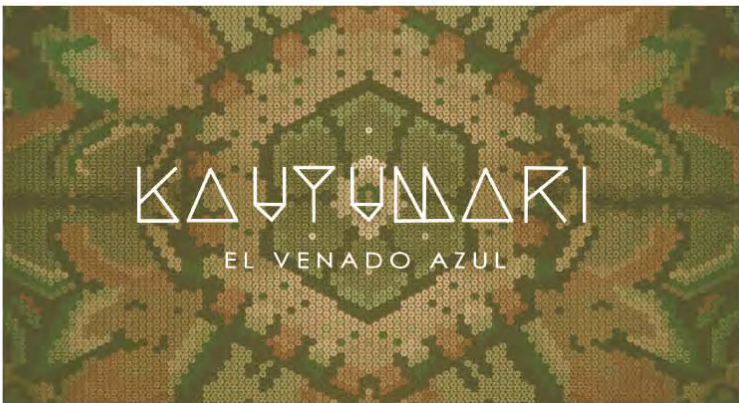
Figura 6: Captura del cortometraje Kauyumari el venado azul de Saiki Estudio.