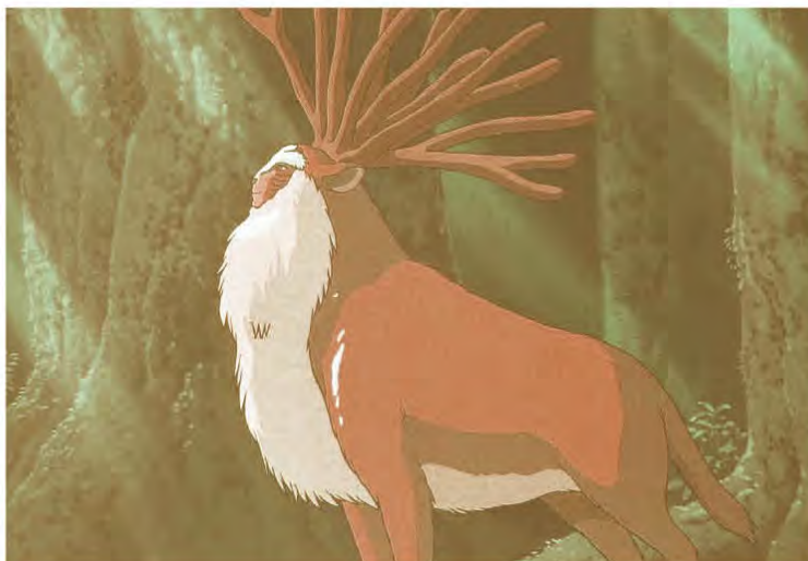
Figura 2: Fragmento de la película "La Princesa Mononoke" de Hayao Miyazaki. Tomada de: Hayao Miyazaki, "The Art of Princess Mononoke", pp. 156, Viz Communications, 2014.

El medio de la animación no se ha quedado atrás, ha venido empleando recursos, tanto técnicos como artísticos, para la creación de contenidos que informen a la población sobre la importancia del cuidado de los recursos naturales; ya sea en campañas publicitarias, en corto o largometrajes; su uso ha permitido que segmentos específicos de la sociedad puedan comprender la importancia de acciones que protejan la naturaleza y la calidad de vida de las sociedades contemporáneas.