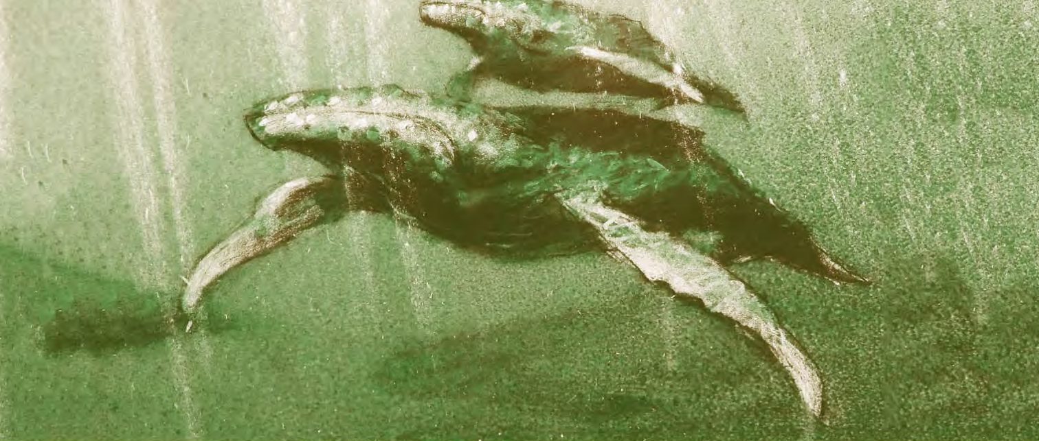
Figura 1: Fragmento del cortometraje "The Mighty River" (El gran río), de Frédéric Back