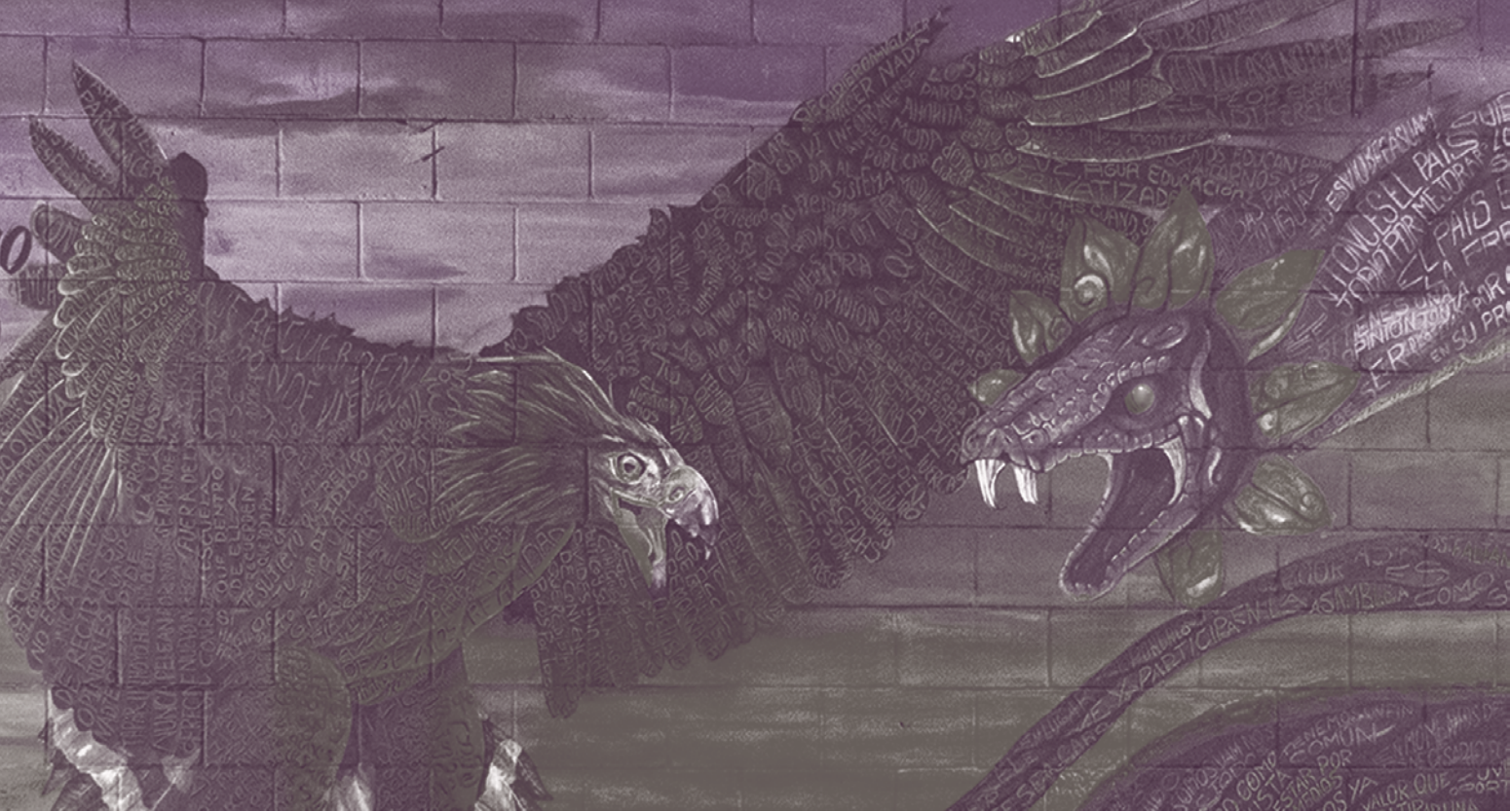
Mural Asociación Disociativa, 2016 (detalle)

En suma, que el mural aquí plasmado, ubicado por cierto en el extremo de las aulas adyacentes a la División de CyAD (entre los edificios P y F, con vista hacia el estacionamiento), se convierte ahora en una invitación a que la comunidad reflexione y promueva el ejercicio de la opinión crítica, pues incluso aquellos comentarios que se pensaban banales y efímeros al final no lo fueron, por más “ridículos” o cómicos que pudieran parecer. El mensaje menos críptico se resume en el lema: “Porque somos como piedras de río que con el roce nos pulimos”.