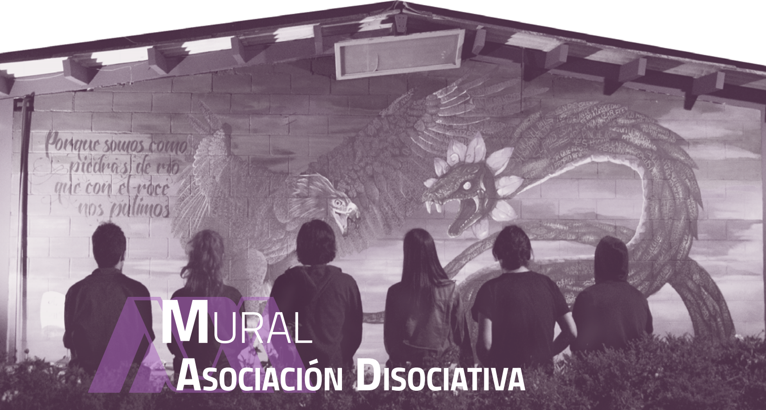
Mural Asociación Disociativa, 2016