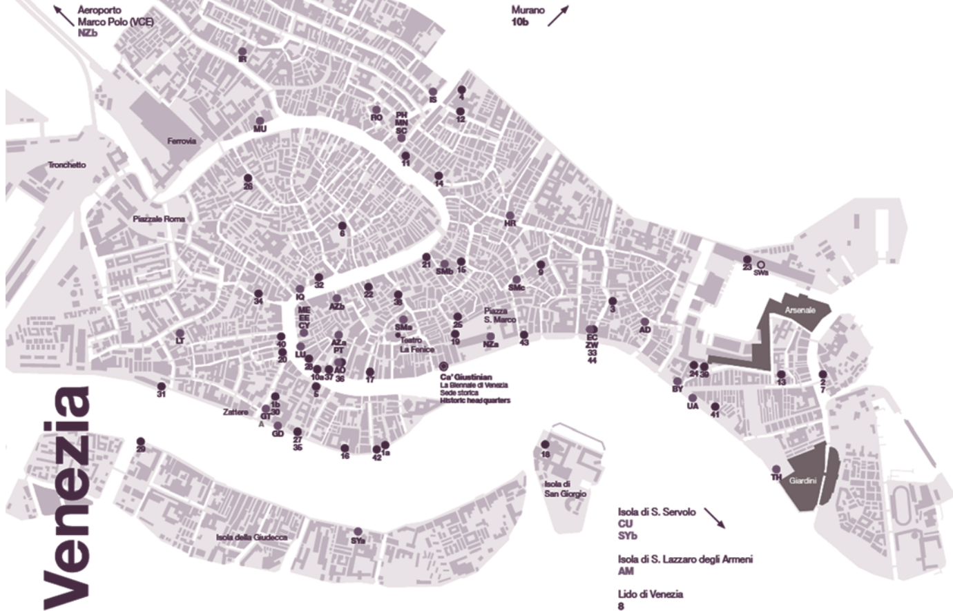
Lugares donde se desarrolla la Bienal de Arte

un templo, un instituto, albergan algo que tiene que ver con la Bienal. O bien, poco a poco, con ayuda de la guía de la Bienal advertiremos con qué se identifica aquello que nos llamó la atención. Es imposible en unos cuantos días visitar todos los sitios propuestos, pero sin duda bastan para darse una idea de lo que sucede, caminando por las calles de la ciudad.