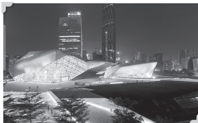
Guangzhou Opera House