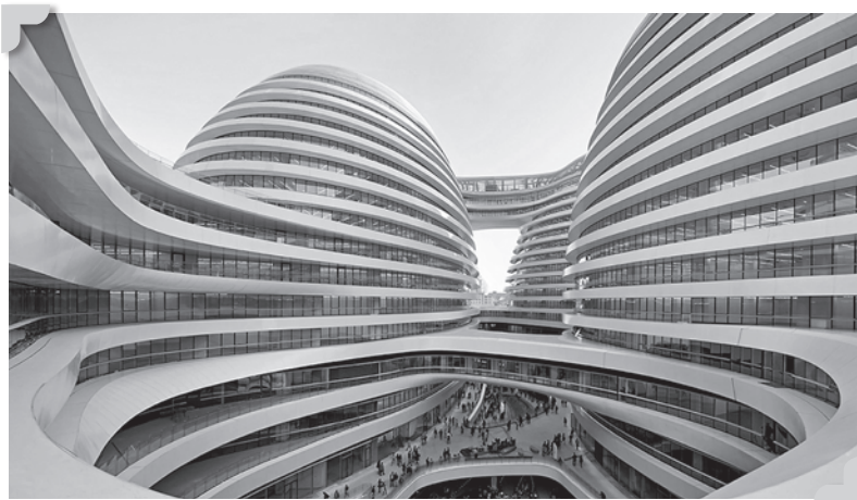
The Galaxy Soho project (Beijing, China)