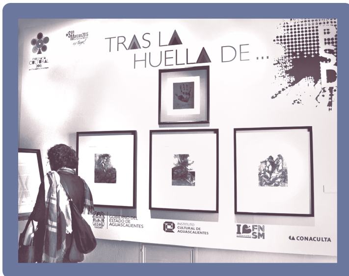
Exposición Tras la huella de Posada Homenaje a Rafael Zepeda

En el Museo José Guadalupe Posada se celebra cada año el concurso de grabado con el nombre del artista, mismo que reúne lo mejor de las manifestaciones de los jóvenes talentos de toda la república.