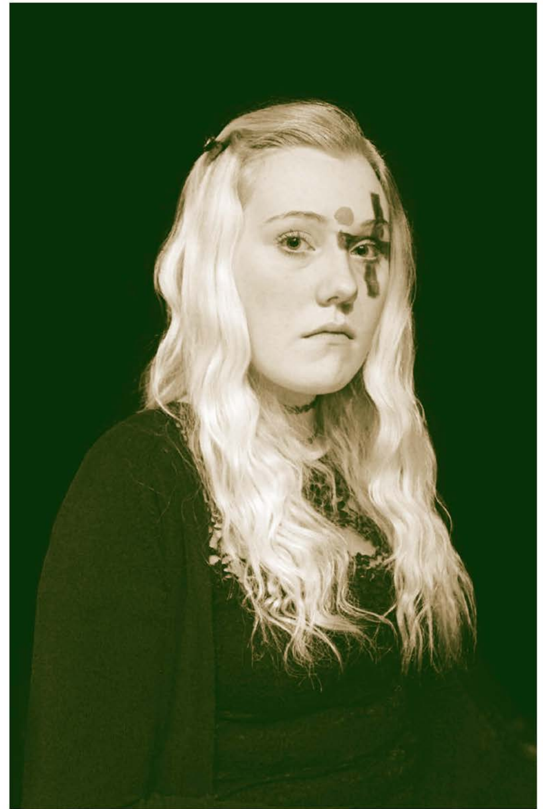
Witch. Fotografía. Proyecto parte de la residencia de arte en Skagastöpng, Islandia, 2012.