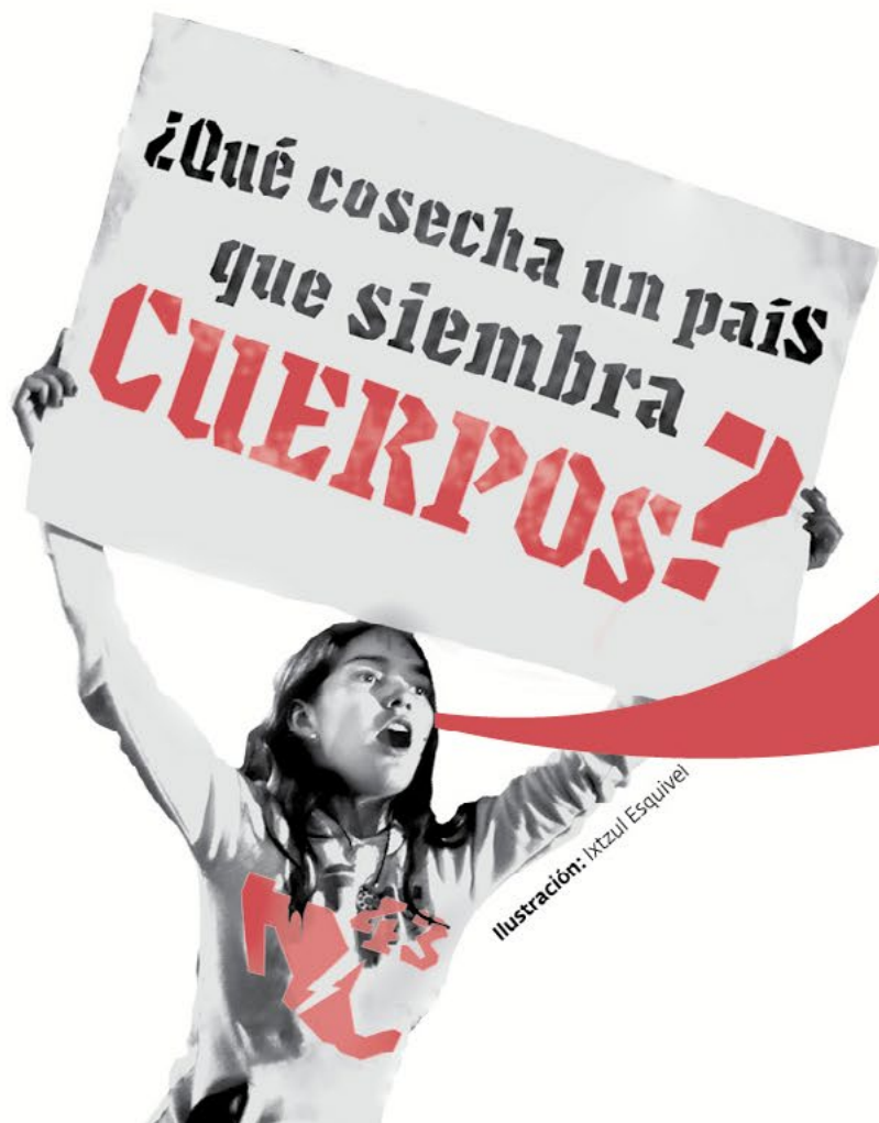
Ilustración: Ixtzul Esquivel