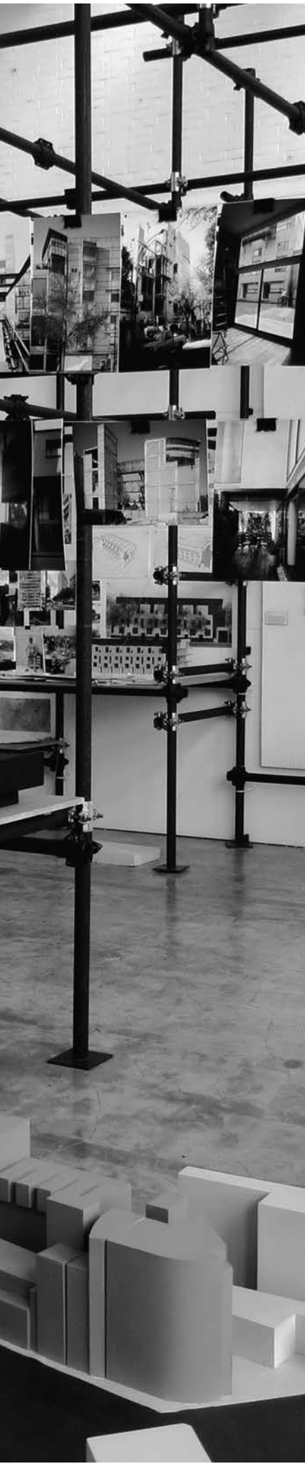
Obras de Javier Sánchez Corral. Galería Benlliure (FA-UNAM), 2014.