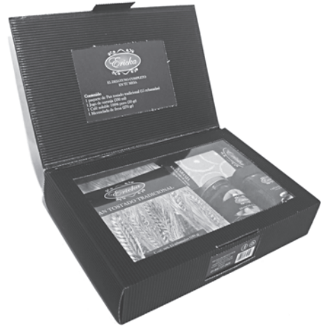
Empaque para desayuno completo

crear una línea de productos con base en ella, y crear un paquete de productos y venderlo como un equipo para un fin destinado.