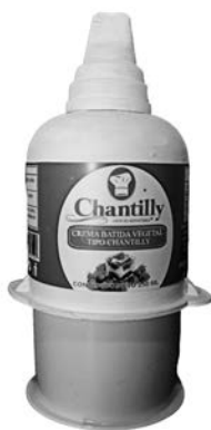
Marca adaptada a un producto distinto