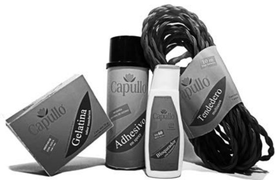
Línea de productos Capullo Fotografías de proyectos Ericka Gómez Navarro