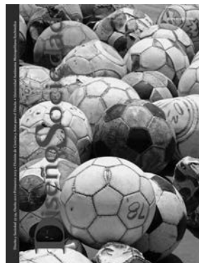
Diseño y sociedad