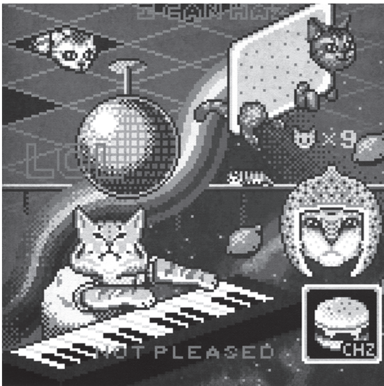
Caturday Night Fever Exhibición MEMES

Muertos, Buffum nos muestra un cráneo decorado, acompañado de flores, es así como nos plantea una manera muy interesante de ver este día festivo a través del Pixel Art .