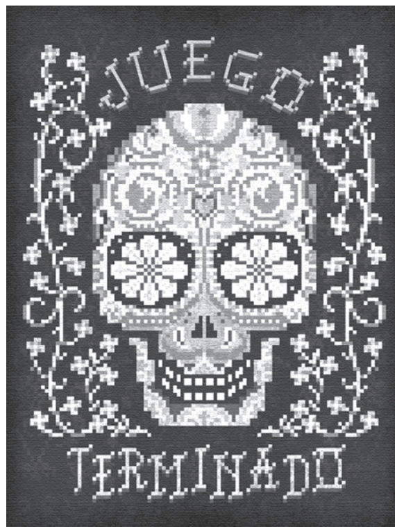
Juego Terminado Exhibición Día de los Muertos

"The Jude" ha pisado terrenos de la política norteamericana con una colaboración, en 2008, para el Shepard Fairey's Manifest Hope Show, el cual formó parte de la Convención Nacional Demócrata en Denver, Estados Unidos de Norteamérica. Para el año 2009 realizó una pieza que formó parte del festival Lincoln 200, celebrado en Filadelfia, evento que conmemoró los 200 años del nacimiento del presidente número 16 de ese país.