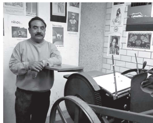
Cirano Reyes