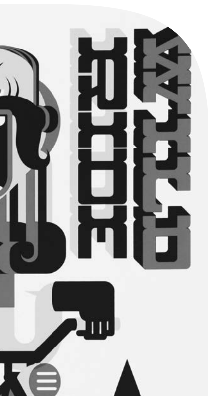
Serigrafía de Mr. Kone http://bit.ly/PyFLMY

acudió acompañado de su equipo al Museo Nacional de Arte para grabar al protagonista del video: Moctezuma.