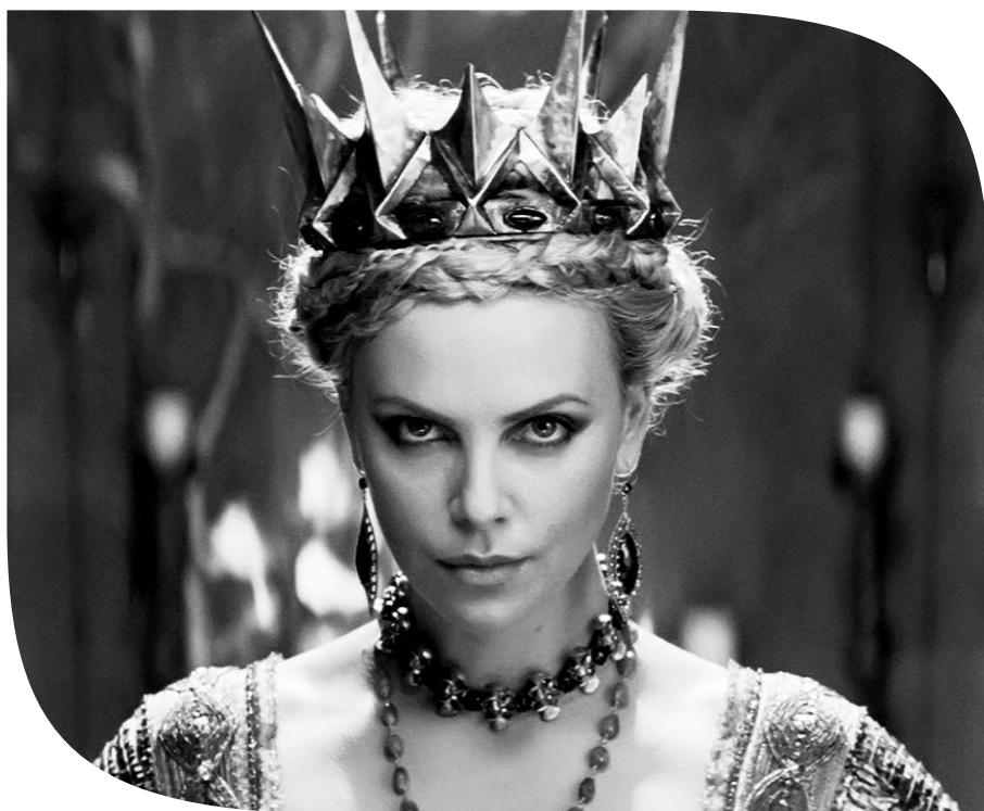
Snowwhite and the Huntsman, película en la que The Mill realizó los efectos visuales. http://bit.ly/TogPKI

Este estudio que tiene brazos y pies en América y Europa ha ganado, entre varios premios, el Cannes Lions Award 2011, por los títulos de apertura de OFFF París 2010. El trabajo de este máster de la animación y los efectos visuales es tan diverso como la cantidad de colores que puede adoptar un camaleón.