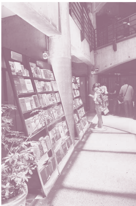
Exhibición y venta de libros sobre la ciudad

El Programa Universitario de Estudios Metropolitanos presentó y destacó la importancia de la revista Territorios Metropolitanos que se publica seis meses; por su parte el Programa de las Naciones Unidas para los Asentamientos Humanos, México dio a conocer el libro Estado de las ciudades de México 2011 .