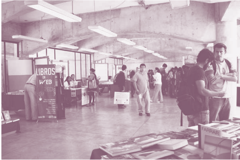
Feria del libro y la ciudad en las instalaciones de CyAD

(Flacso), Universidad Iberoamericana, Coedimex, Visualibros, Programa Universitario de Estudios Metropolitanos (PUEM) y, por supuesto, la UAM con publicaciones de todas las unidades, mismas que aplicaron un descuento al público del 15 al 50 por ciento, y en el caso de las otras editoriales dieron facilidades de pago.