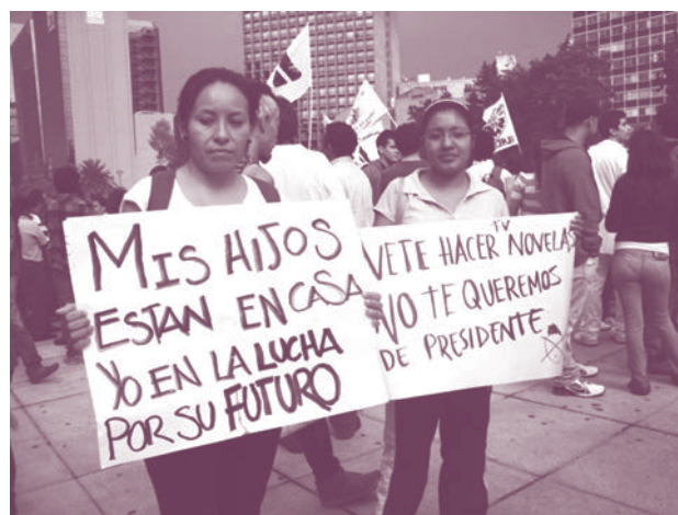
Marcha en Revolución