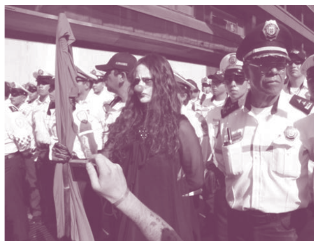
Marcha en Televisa San Ángel