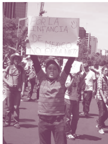
Marcha en el Ángel de la Ciudad de México

En las redes sociales, en especial en Twitter se le conoce como Hashtag (etiqueta) a los temas precedidos con un signo #, con el fin de agrupar las búsquedas. Se hicieron los temas #yosoy131 que correspondía a los jóvenes del video de la Ibero y el #yosoy132 que se designó a cualquier persona