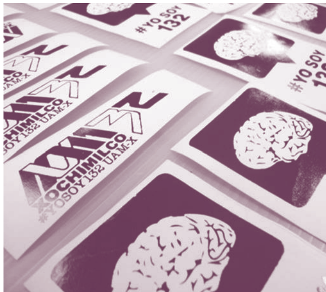
Logotipo oficial del movimiento #yosoy132

Parte de los logros que ha tenido el Comité de Diseño es la creación de un logotipo especial para el movimiento #yosoy132 en la UAM Xochimilco, que consiste en una estilización del los números 1, 3 y 2 de manera que parezca una extensión del propio logo de la UAM; en este sentido se ha procurado no alterar las condiciones legales del logotipo universitario. Otra idea de este comité fue difundir el movimiento a través de playeras estampadas; la idea en un principio era motivar a los compañeros a formar parte de esta movilización, y que éstos no creyeran que eran grupos partidistas, rebeldes, o porros , sino que vieran que los estudiantes eran el compañero, el amigo, el novio o las personas con las que sí se identificaban; la playeras fueron un éxito, pues mientras que al principio se solicitaba la cooperación para solventar los gastos de materiales, fue tal la demanda, que al final este