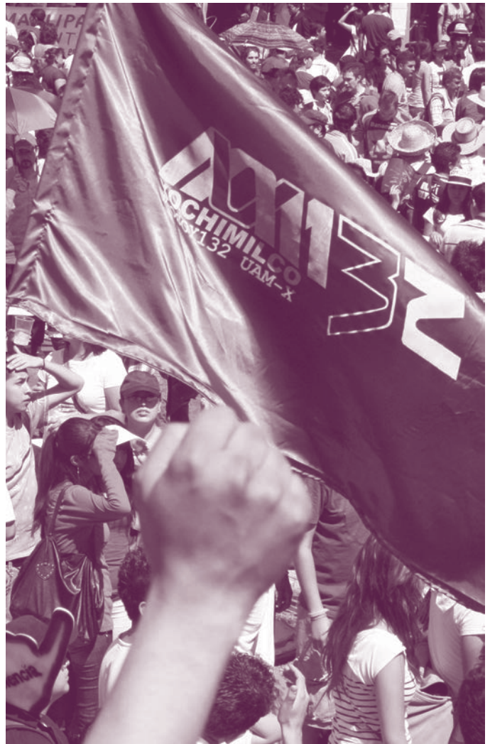
Bandera de la UAM #yosoy132

Desde las pasadas elecciones se han llevado a cabo diversas actividades: encuentros, marchas y plantones, y quizá el movimiento se haya diluído un poco; quizá sean los más, los que cada día se incorporan a la vida cotidiana. Las ilusiones, la esperanza y el afán de luchar por un México mejor aún no terminan, lo que debe prevalecer es la unión entre los estudiantes, el compartir los sentimientos con el compañero de lucha, con lo cual se acabaron las batallas, las afrentas, entre la UAM, la UNAM, y el Politécnico, y también las diferencias socio-económicas al marchar al lado del compañero de la Ibero, la UVM, el TEC, el ITAM: un movimiento donde el intercambio cultural estuvo presente al participar universidades de los estados. Ése es el verdadero valor de este momento, de este movimiento.*