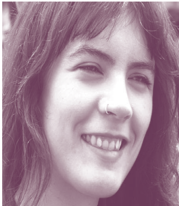
Camila Vallejo en la UAM-X

Asimismo, se llevó a cabo la cuarta Asamblea Interuniversitaria, realizada el 26 de junio de 2012, con la participación de universidades de todo el país y donde se llegó a acuerdos llevados de las asambleas