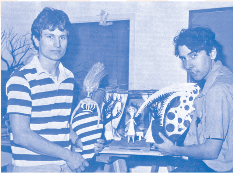
Vincent Price y Tim Burton