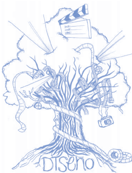
Metáfora ilustrada del diseño en el cine

Ilustración: Libier Falcón García y Alejandro Esquivel Cano