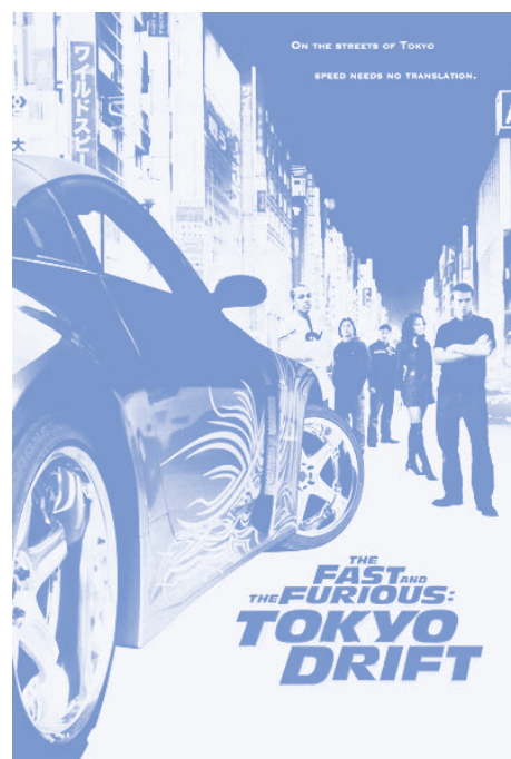
Rápidos y furiosos, reto Tokio , 2006

Tanto en las películas como en la vida no se puede dejar de mencionar el tema del amor, lo cual nos remite a la ciudad de París, Francia. En particular, el Arco del Triunfo de L'Étoile debe estar presente, ya que esta obra arquitectónica, con su gran bóveda arcada, aparece con frecuencia verla en las películas de