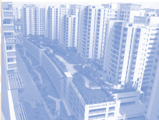
Punggol Roof Garden , 2003