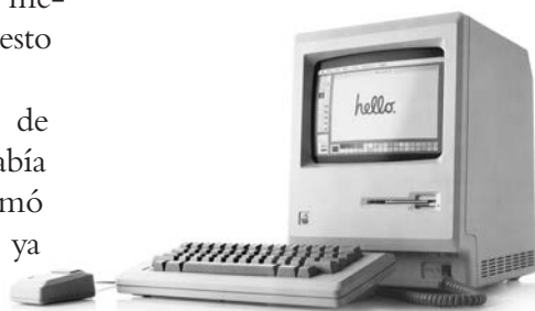
2. La Macintosh de 1984.

Ahora bien, las aportaciones que Steve Jobs hizo no sólo se dieron en términos de la informática y el desarrollo de sus amigables sistemas operativos; sino también representaron desde sus inicios un gusto muy especial por el diseño: en particular, el dise-