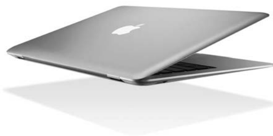
3. Actual Apple Macbook Air.

El genio ha partido y sólo queda el fruto de su trabajo; son muchas las anécdotas que se pueden escribir acerca de la vida de Steve Jobs, seguramente vendrán artículos, libros y películas, no es para menos, pero sirva pues esta breve semblanza para recordar sólo un poco de lo mucho que este hombre aportó al diseño y al mundo, para hacernos quizá la vida más fácil y entretenida: los diseñadores así lo reconocemos. •