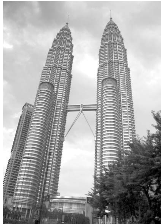
1. En su momento, Las Petronas fueron el edificio más alto del mundo, lo que junto con la puerta formada por las dos torres y el puente que las une, colocó a Malasia en la mira mundial.