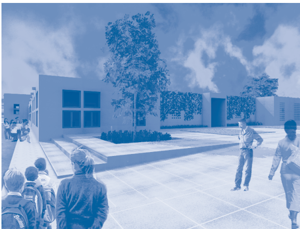
Volúmenes puros se apropian del terreno irregular y juegan con la sensibilidad del sitio.

Los espacios son dispuestos según la actividad funcional que albergan y son coherentes con sus cualidades arquitectónicas. Se organizan tres grandes