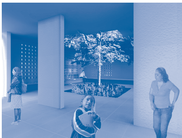
Puntos de encuentro y espacio colectivo: lugares abiertos para la interacción y el vínculo con otras áreas.