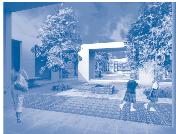
Patio central semicubierto, con un eje lineal simétrico que distribuye hacia ambos lados los locales.